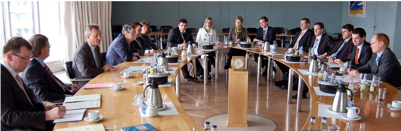
AGV-Dialogprogramm: Studenten diskutieren mit dem bayerischen Staatsminister Siegfried Schneider (3.v.l.) im Kabinettsaal der Staatskanzlei