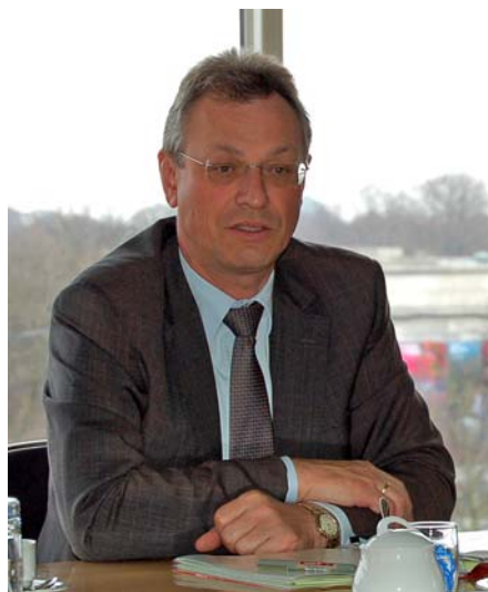
Staatsminister Siegfried Schneider, Chef der bayerischen Staatskanzlei

Als besonderes Ziel der bayrischen Landespolitik beschrieb Schneider den Abbau der Schulden. Bayern habe hier im Vergleich zu den anderen Bundesländern Vorbildliches geleistet. „Wir haben sogar begonnen, Schulden zurückzuzahlen. Das ist einmalig.“ Zu dieser Sparpolitik gäbe es keine Alternative, denn Schuldenberge stellten eine große Belastung für die junge Generation dar. Trotzdem müsse auch investiert werden, etwa in die Hochschulen. Schätzungen gingen davon aus, dass die Studentenzahlen bis 2050 um bis zu 25 Prozent steigen würden. Bis 2011 würden daher 3000 neue Studienplätze geschaffen. Weiterhin bemühe man sich um die Verbesserung des baulichen Zustandes der Hochschulen.